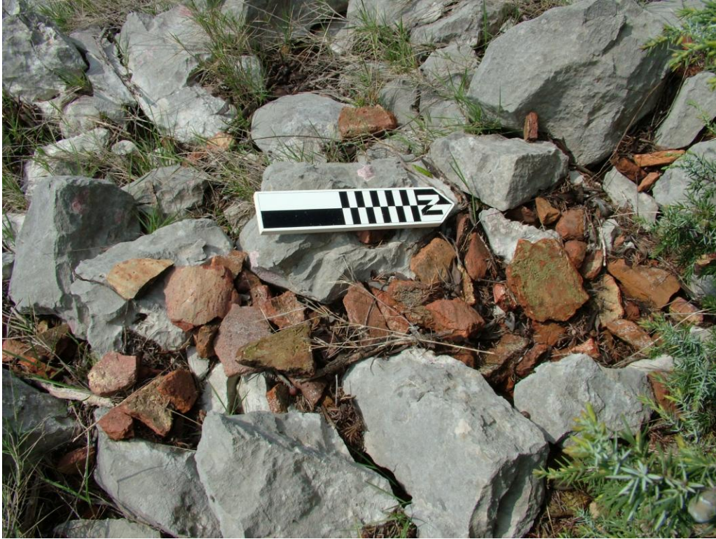
Keramički ulomci u denudiranoj bedemskoj masi na gradini Straišće