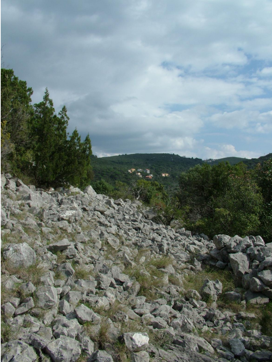
Denudirana bedemska masa praistorijske gradine Straišće (publikovao M. Petričević)