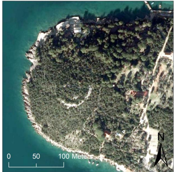
Prikaz praistorijske gradine iz zraka R.A.F. 1944 i UZN 2012 (publikovao M. Petričević)