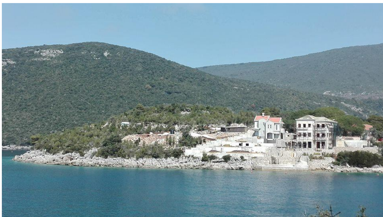
Rt Ograda 2017. godine. U pozadini novoizgrađenih objekata nazire se bedemska trasa praistorijske gradine Straišće