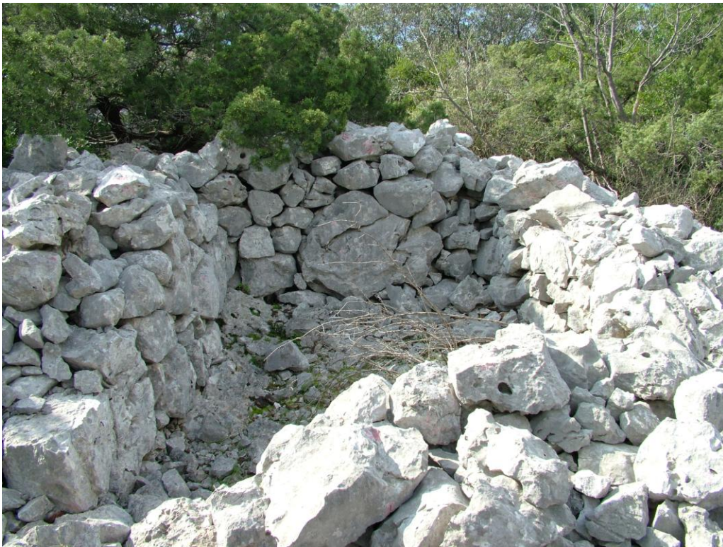
Objekat prislonjen uz suhozidnu razdjelnicu gradine Straišće