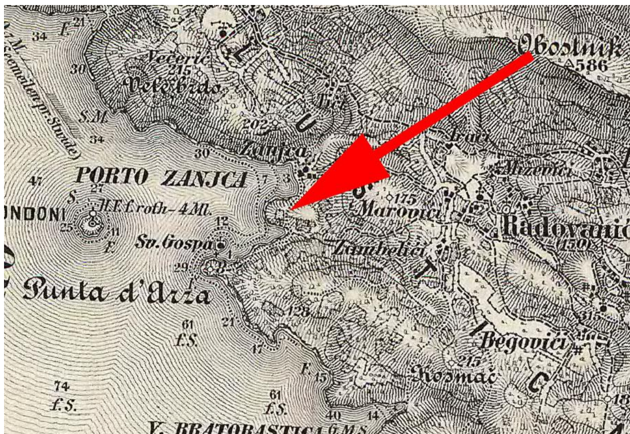
Treći vojni premjer Austrougarske monarhije ( Die dritte militärische Aufnahme der Österreichisch-Ungarischen Monarchie )